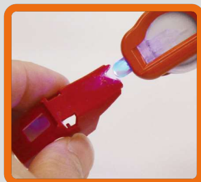
プラモデルのパーツ修理や成型に