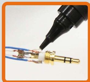
ヘッドホンプラグの修理に

多くを海外製が占める紫外線硬化の液体プラスチックに、日本製のUV BONDYが誕生しました! 容量もこれまで一般的だった3~5mlからおおよそ2倍の10ml入り。 液体プラスチックを塗布して専用のUV LEDライトを4秒照射すると、瞬時に硬化します。