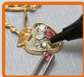
アクセサリーの作成や修繕に