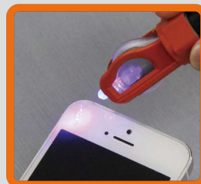
スマホのガラスフィルム修理に